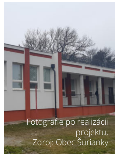
Fotografie po realizácii projektu, Zdroj: Obec Šurianky