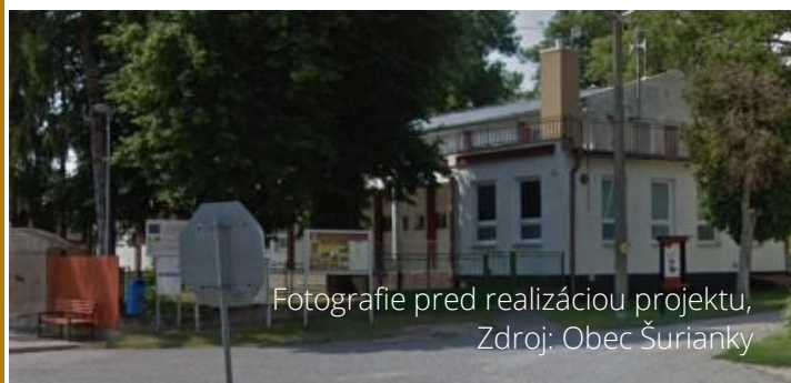
Fotografie pred realizáciou projektu

stredníctvom investícií súvisiacich s vytváraním podmienok pre trávenie voľného času a rozvoj kultúry a ochranu tradícií“. Tento cieľ sa dosiahol vďaka realizácii projektu, ktorý riešil v záujmovom území obce Šurianky rekonštrukciu kultúrneho domu ako miesta pre stretávanie sa a organizovanie kultúrno – spoločenských podujatí pre obyvateľov obce ako aj návštevníkov obce Šurianky.