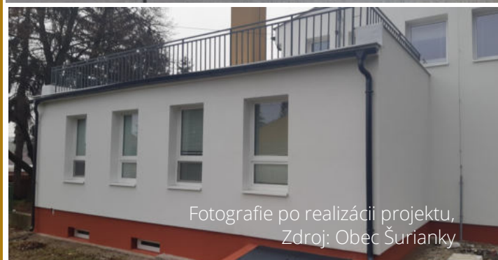
Fotografie po realizácii projektu