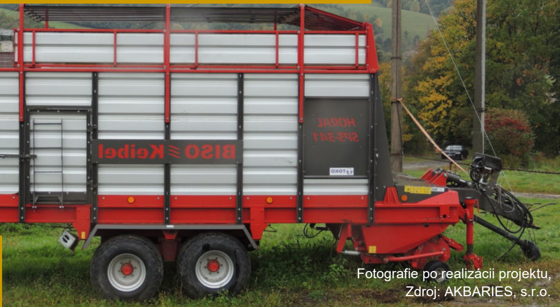
Fotografie po realizácii projektu

Predmetom predkladaného projektu boli investície do poľnohospodárskych strojov pre živočíšnu výrobu, predovšetkým v oblasti zberu objemových krmív, ich uskladnenia a manipulácie. Konkrétne sa jedná o nákup týchto strojov: kolesový traktor, krmný voz, prepravník balíkov, samozberací voz a zhrabovač krmovín. Hlavným cieľom projektu bolo zvýšenie konkurencieschopnosti spoločnosti AKBARIES, s.r.o. a zefektívnenie výroby poľnohospodárskych produktov, konkrétne v chove dobytky mäsového typu v ekologickom systéme hospodárenia. Špecifické cie-