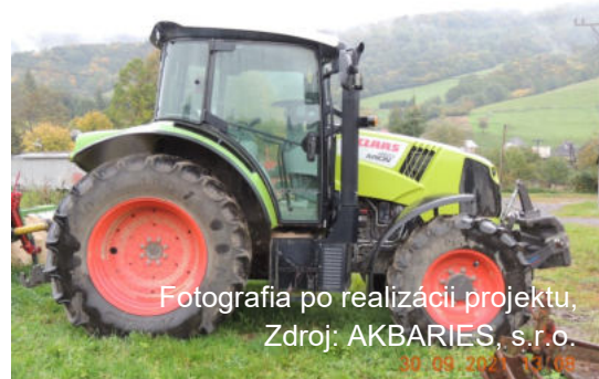
Fotografia po realizácii projektu, 30.09.2021 11:09

Predmetom predkladaného projektu boli investície do poľnohospodárskych strojov pre živočíšnu výrobu, predovšetkým v oblasti zberu objemových krmív, ich uskladnenia a manipulácie. Konkrétne sa jedná o nákup týchto strojov: kolesový traktor, krmný voz, prepravník balíkov, samozberací voz a zhrabovač krmovín. Hlavným cieľom projektu bolo zvýšenie konkurencieschopnosti spoločnosti AKBARIES, s.r.o. a zefektívnenie výroby poľnohospodárskych produktov, konkrétne v chove dobytky mäsového typu v ekologickom systéme hospodárenia. Špecifické cie-