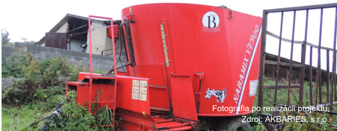
Fotografia po realizácii projektu, Zdroj: AKBARIES, s.r.o.

le projektu boli zabezpečiť dodržiavanie noriem v oblasti chovu hovädzieho dobytku a ochrany životného prostredia, výrazne zlepšiť životné podmienky chovaných zvierat, znížiť výrobné náklady a zvýšiť pridanú hodnotu poľnohospodárskej produkcie spoločnosti, vytvoriť min. 1 nové pracovné miesto a iné.