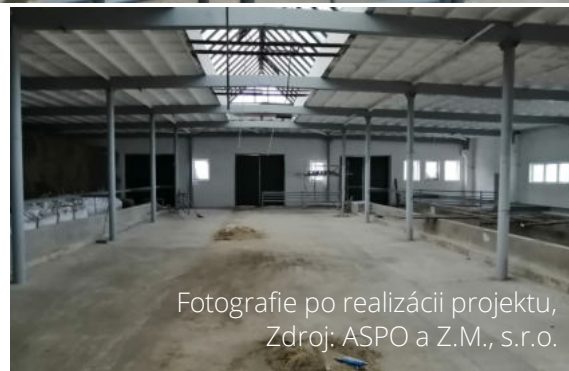
Fotografie po realizácii projektu