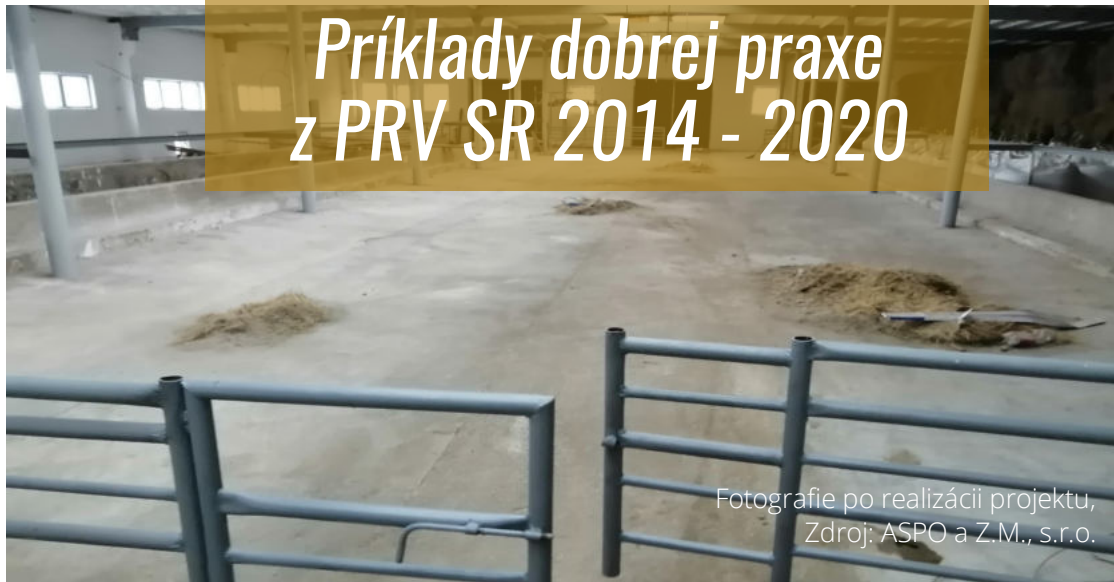
Fotografie po realizácii projektu