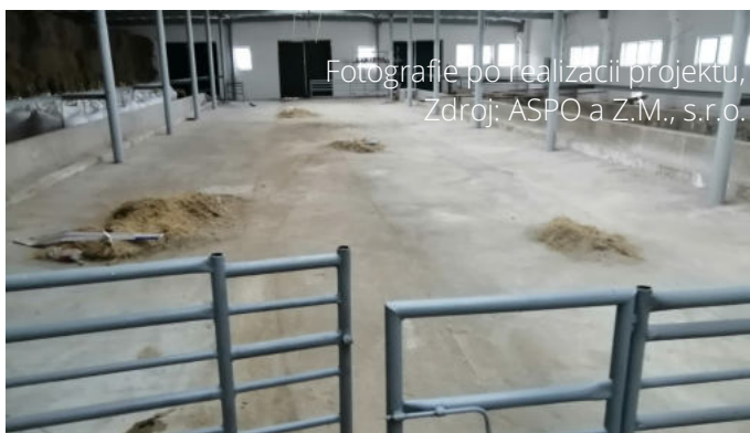
Fotografie po realizácii projektu

Predmetom predkladateľného projektu bola rekonštrukcia maštale pre chov hovädzieho dobytká a nákup diskovej žacej kosa. Cielom projektu bolo zlepšenie výkonosti podniku, výroby, zavedenie inovatívnych technológií, ktorými budú vytvorené vhodné podmienky na chov hovädzieho dobytká aj ekochov výkrm. Všetko prebiehalo s ohľadom na zvýšenú pracovnú pohorekonštrukcia maštale du. Pri kúpe nových strojov vzhľadom na operácie, bolo cieľom znížiť spotrebu PHM a mazív a hlavne znížiť náklady na opravy. Hlavným cieľom bol a najmä efektívna výroba v trhovom prostredí tak, aby chov hovädzieho dobytká bol aj ekonomický.