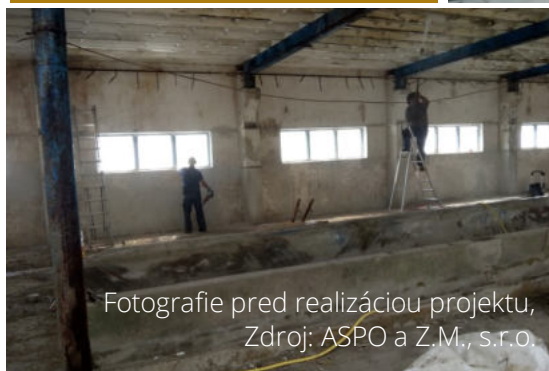
Fotografie pred realizáciou projektu, Zdroj: ASPO a Z.M., s.r.o.