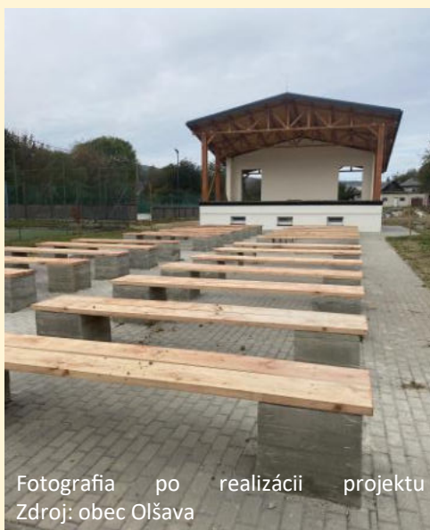
Fotografia po realizácii projektu

Schválená výška príspevku z PRV SR 2014 - 2020: 144 007,85 €